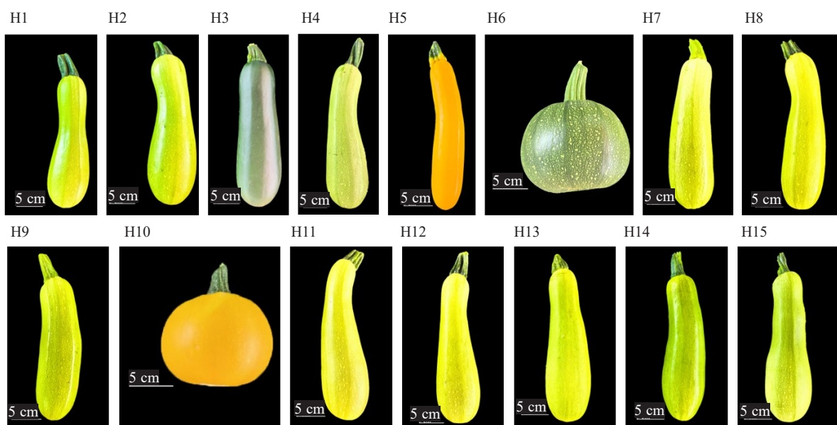
图 1 供试的 15 个西葫芦品种表型